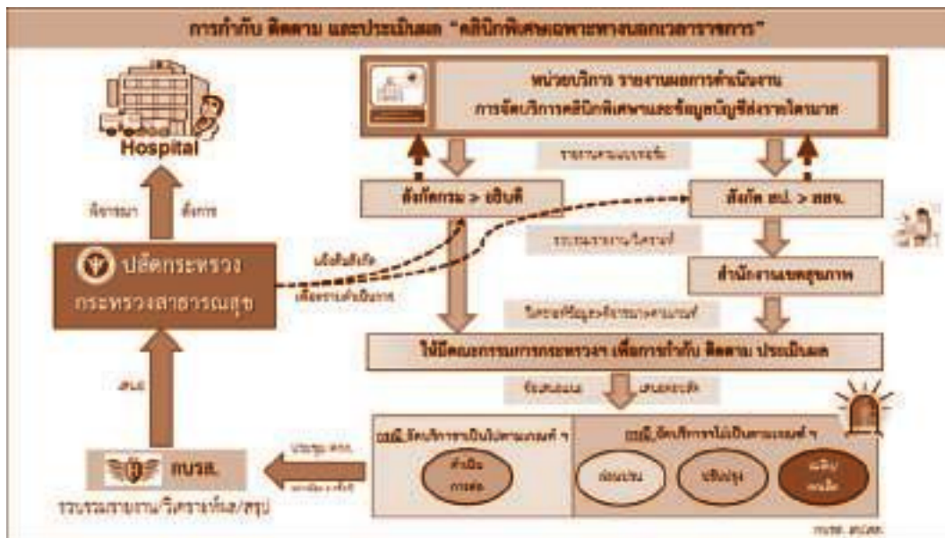
ภาพที่ 5 ภาพแสดงขั้นตอนการดำเนินการจัดบริการคลินิกพิเศษเฉพาะทางนอกเวลาราชการ (ด้านการกำกับติดตาม/รายงาน/ประเมินผลการจัดบริการ)

ให้ผู้ตรวจราชการกระทรวงสาธารณสุขประชุมเพื่อพิจารณาปัญหาตามวรรคสองและหาแนวทางแก้ไขปัญหาโดยรีบด่วน ทั้งนี้ ปลัดกระทรวงสาธารณสุขอาจมอบหมายให้กองบริหารการสาธารณสุข สำนักงานปลัดกระทรวงสาธารณสุขเข้าร่วมประชุมเพื่อพิจารณาปัญหาดังกล่าวด้วยก็ได้