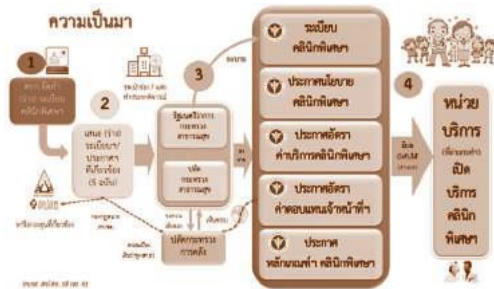
ภาพที่ 1 ภาพแสดงความเป็นมาการจัดการทำระเบียบกระทรวงสาธารณสุขการจัดบริการคลินิกพิเศษเฉพาะทางนอกเวลาราชการของหน่วยบริการในสังกัดกระทรวงสาธารณสุข ปี 2561

เช่น เรื่องการจัดการสถานที่แยกสัดส่วน เปลี่ยนเป็นให้หน่วยบริการสามารถจัดบริการในที่เดิมที่หน่วยบริการมีความพร้อม แต่เน้นการให้บริการที่สะดวกรวดเร็ว รวมทั้งปรับปรุงการจ่ายค่าตอบแทนฯ เพิ่มจากระเบียบบฯ CHC และที่ประชุมผู้บริหารระดับสูง มีมติให้หลีกเลี่ยงการใช้คำว่า Premium เนื่องจากเป็นคำที่แสดงถึงความคาดหวังสูงจากผู้รับบริการ หากได้รับบริการที่ไม่เป็นที่พึงพอใจ อาจเป็นเหตุที่หน่วยบริการจะได้รับข้อร้องเรียน