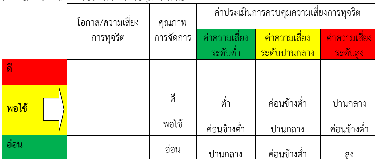
ตารางที่ ๔ ตารางแสดงการประเมินการควบคุมความเสี่ยง